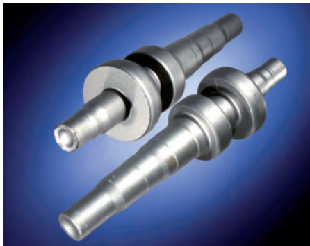
Bild 6: Kalt mit Hinterschnitt umgeformte Getriebewellen. Dieser Verfahrenstrick ermöglicht die Kombination der geringen Aufmaße der Kaltumformung mit weiteren Werkstoffeinsparungen zwischen den Festrädern der Getriebewelle