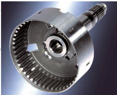
Bild 4: Einbaufertig kaltumgeformte Lamellenverzahnung. Durch die Kaltverfestigung an den Flanken der Verzahnung können weitere Warmbehandlungsschritte eingespart werden. Die Verzahnung wird ohne weitere Nachbearbeitung eingesetzt