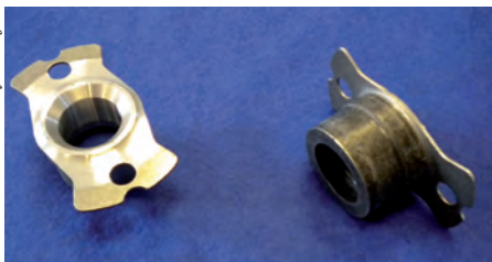
Bild 5: Kaltfließgepresste Lenkradnabe mit einer Flanschdicke von 1mm mit speziell abgestimmten Materialeigenschaften (Faserverlauf und Kaltverfestigung) im Flansch