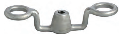
Bild 3: Der filigrane Hängebügel aus Edelstahl wiegt nur 190 g und wird auf einer Spindelpresse gefertigt. Der ununterbrochene Faserverlauf und die belastungsgerechte Materialverteilung gewährleisten maximale Belastbarkeit