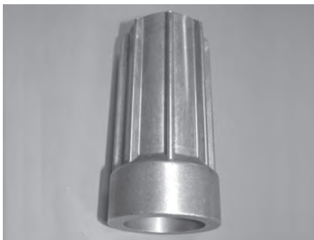
Bild 7: Kaltfließgepresstes Innenteil eines innovativen Dämpfungselements für den Antriebsstrang von heckgetriebenen Fahrzeugen aus C15. Aufgrund der Kaltverfestigung erreicht das Bauteil die geforderten mechanischen Eigenschaften ohne weitere Wärmebehandlung

ren. Das Temperaturgebiet der Halbwarmumformung liegt bei Stahl zwischen 700 und 950 °C und damit meist oberhalb bzw. nur knapp unterhalb der Austenitumwandlungstemperatur von 723 °C. Dies bedingt geringere Kräfte und erhöhtes Formänderungsvermögen im Vergleich zur Kaltumformung, während Werkzeugbeanspruchung und Zunderbildung deutlich geringer sind als bei der Warmumformung.